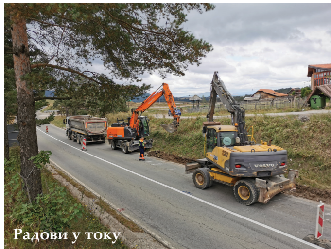
Радови у току