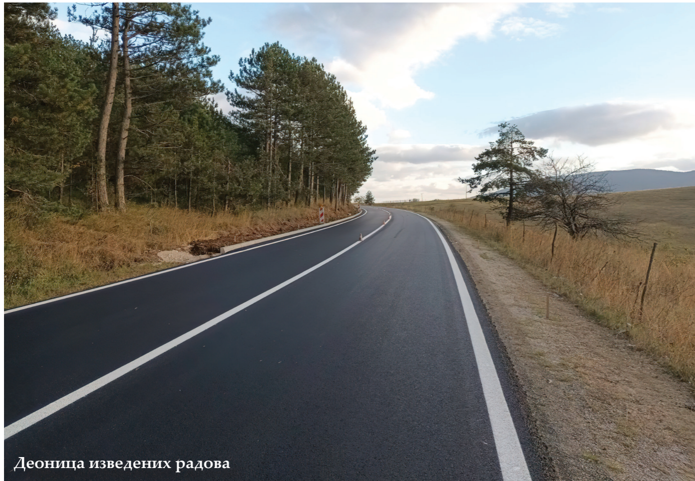
Деоница изведених радова