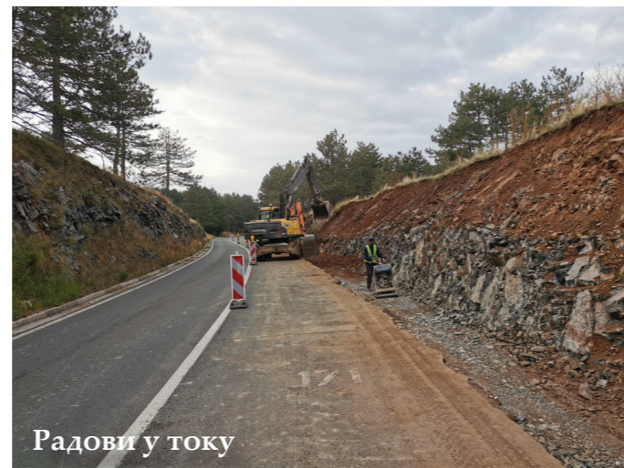
Радови у току